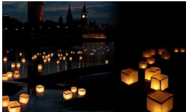
Cubos de jardín con luz / Cubos de luz flotantes

http://decompras.org.es/comprar/cubos-luz-flotantes.htm