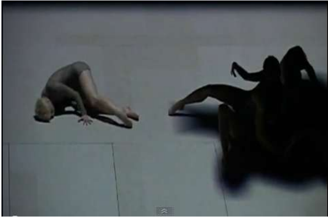
Mortal Engine By Chunky Move

http://www.youtube.com/watch?feature=fvwp&v=Sbjomualivs&NR=1