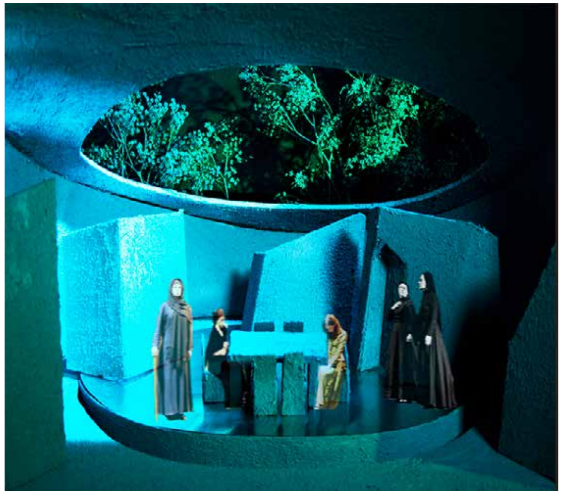
Teatro 2 La casa de Bernarda Alba